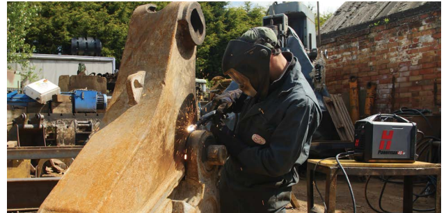
Wartung und Reparatur